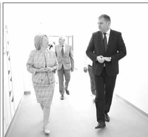
Primăria Municipiului Sibiu