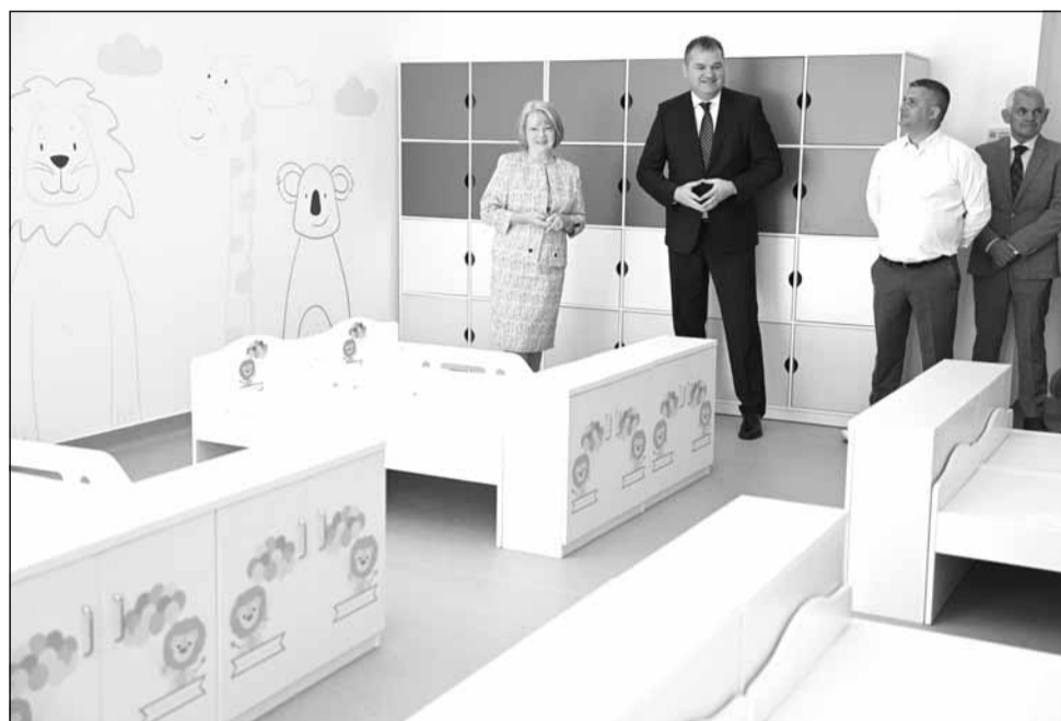
Primăria Municipiului Sibiu

După deschiderea acestei unități, municipalitatea pregătește inaugurarea celei de-a doua creșe construite prin CNI, pe strada Viitorului, care va pune la dispoziția familiilor sibiene încă 110 locuri pentru copiii de vârstă antepreșcolară.