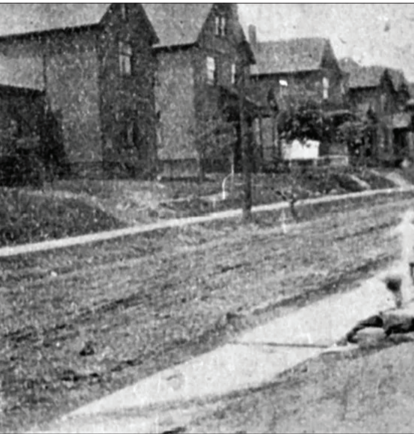
ngstown (Ohio), 1911

secolului al XIX-lea. În numai câțiva ani au trimis acasă câteva milioane de dolari.