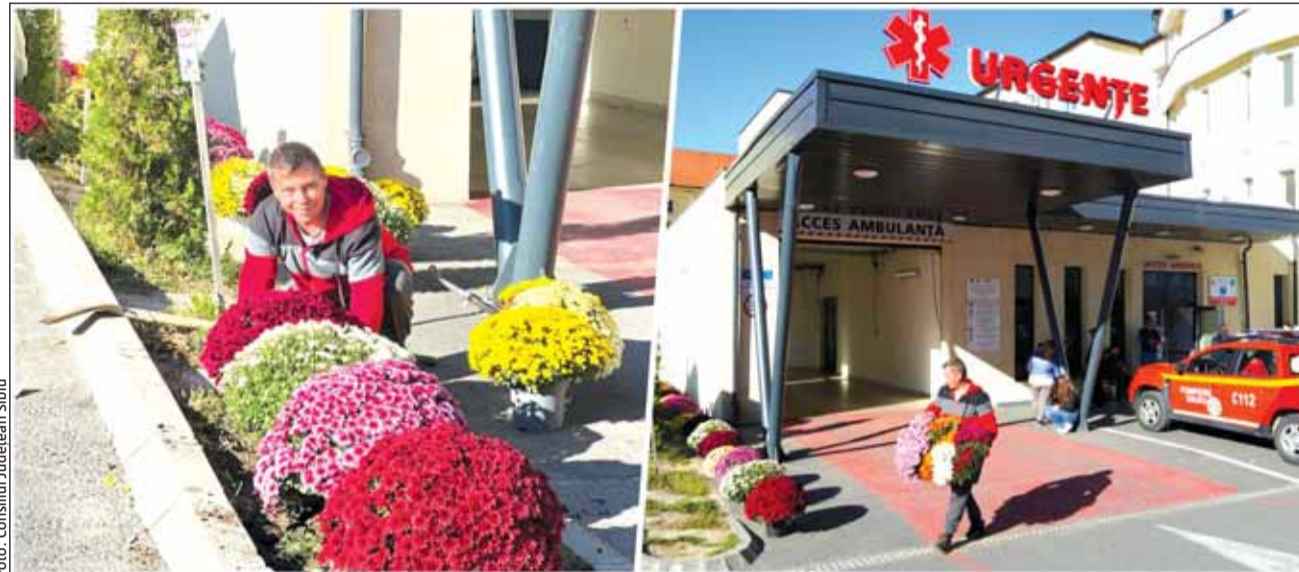
„Oamenii sunt buni”

Așa se face că la Piața „Transilvania” din Sibiu, unde vin peste 200 de producători locali, pe lângă multele ghivece cu flori, sibianul a adus și legume proaspete. „Clienții vin, se uită la produse, apoi se uită la mine și mă întreabă dacă sunt «Omul cu florile de la Urgență»”.