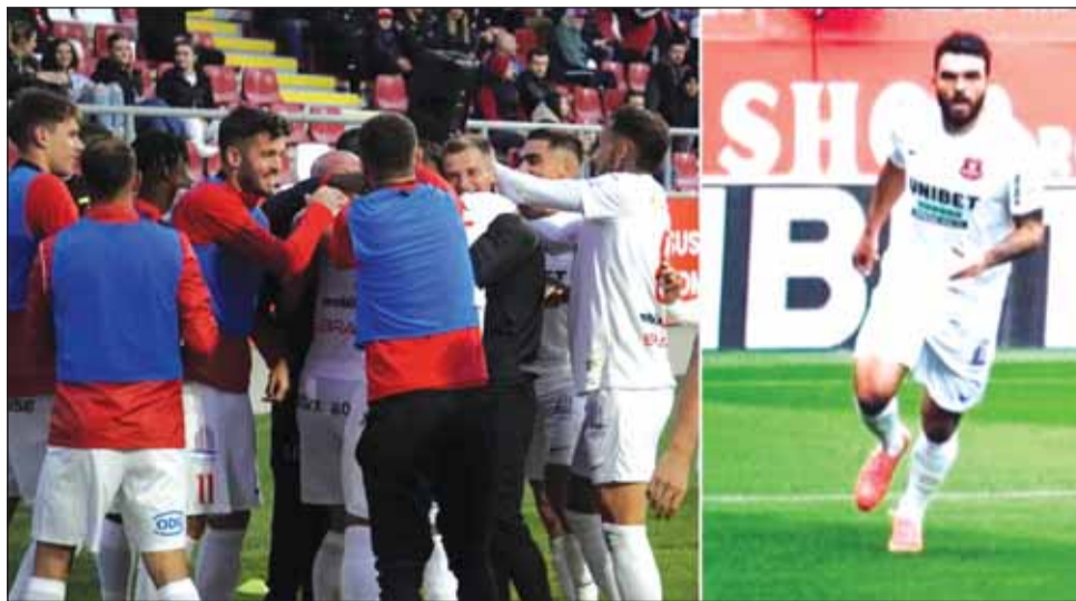
Chițu a marcat din nou la Arad, după ce spărsese gheața pentru FCH în runda precedentă

Cu 3 victorii în ultimele 4 etape, elevii lui Măldărășanu