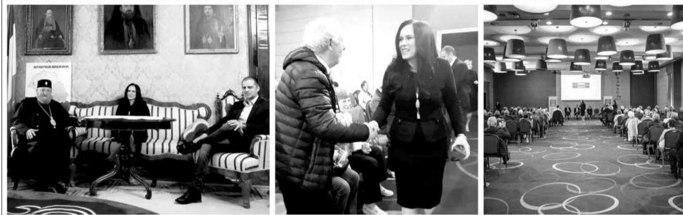
Deputat Bogdan Trif, Președintele Organizației Județene PSD Sibiu