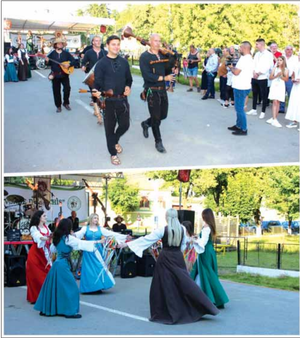
Gazda acestei întâlniri de neuitat va fi Green Man Foundation, iar parteneri ai evenimentului sunt „Anii Drumetiei”, My Transilvania și Accademia Templare – Templar Academy de la Roma – Secțiunea Transilvania.

Nu ratați ocazia unică de a descoperi frumusețile și tradițiile autentice ale unui sat saxon ce împletește istoria cu frumusețea peisajelor rurale transilvănene. Descoperiți ospitalitatea localnicilor și farmecul vieții la țară, într-un decor care pare desprins din cărțile de poveste. Este vorba despre satul Richiş, din comuna Biertan, care sâmbătă, 20 aprilie, își redeschide larg porțile pentru turiști, în cadrul Zilei Porților Deschise. Evenimentul va fi o celebrare a culturii, tradiției și naturii, unde fiecare moment este gândit să vă încante sufletul și să vă îmbogățească cunoștințele despre această zonă încărcată de istorie. Veți păși într-o lume unde patrimoniul cultural și frumusețea naturală se împletesc într-o armonie desăvârșită.